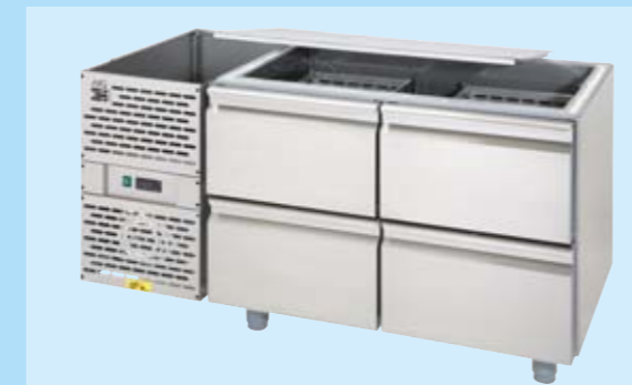
Kühltisch ohne Tischplatte, mit Kühlraumabdeckung lieferbar für 600 mm- und 700 mm-Bautiefe