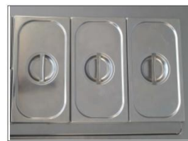
Konfigurationsbeispiele M40: 1xGN1/3 + 1xGN 1/1 VASCA M80: 2xGN1/3 + 2xGN 1/1 VASCA