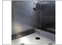
Wasserspender im Tank.